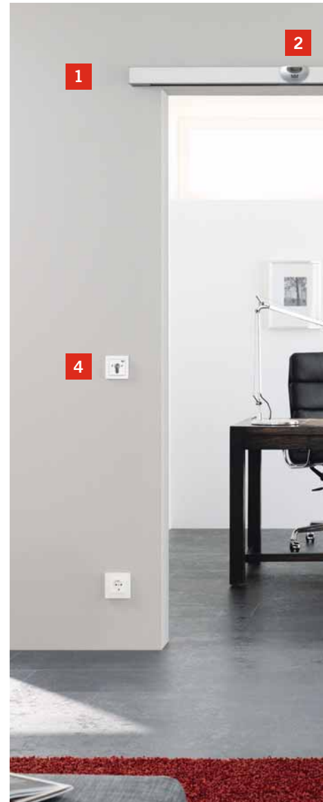
Oberfläche DORMA Design Niro matt. Der CS 80 MAGNEO mit DORMA Design Niro matt Oberfläche – passend zur Edelstahl-Optik des AGILE (Bild unten).

Der automatische Schiebetürantrieb CS 80 MAGNEO bietet jetzt neben der bekannten Aluminium-Oberfläche auch eine Oberfläche in Edelstahl-Optik: DORMA Design Niro matt. Das klare Design harmoniert mit der Edelstahl-Optik des manuellen Schiebetürantriebs AGILE und betont das hochwertige und moderne Gesamtkonzept der Inneneinrichtung. Ebenfalls mit Design Niro matt verfügbar sind die MANET Glashalterungen und die Griffmuschel. Die neue Verriegelungsfunktion schützt Räume vor dem Zutritt durch Unbefugte. Sie ist von außen unsichtbar unter der Abdeckung installiert. Ein Schlüsseltaster steuert die Ver- und Entriegelung.