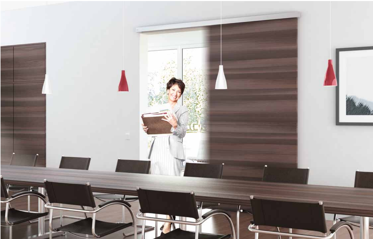
Schiebetür-Automatik CS 80 MAGNEO – hier an dem Holztürlügel eines Konferenzraums verbaut.

„Wenn wir alle Hände voll zu tun haben, sind Automatiktüren eine große Erleichterung.“