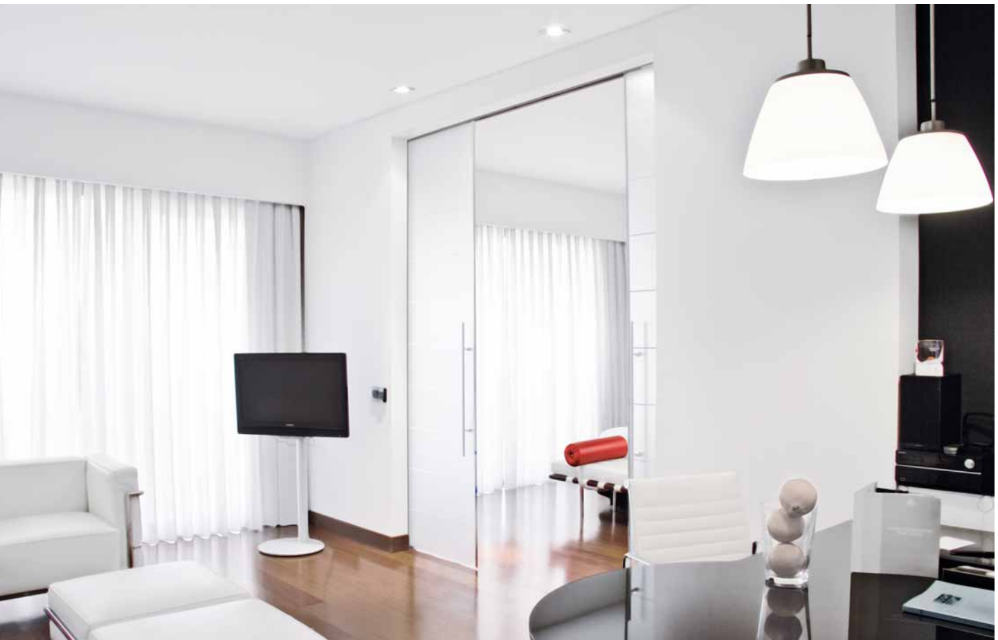
Manuelle Schiebetür AGILE 150 in einer doppelflügeligen Ausführung – hier auf der Schlafzimmersseite des Hotelzimmers installiert.

— Komfortabel und platzsparend im Innenbereich.